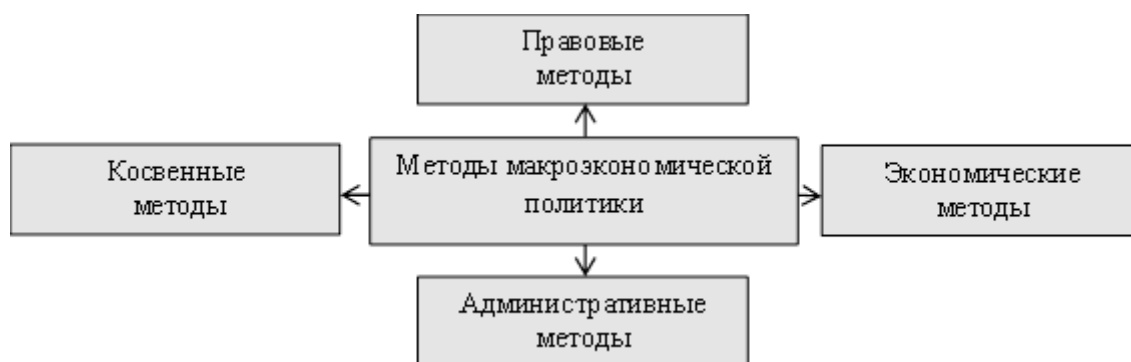
Рисунок 1.2 - Методы макроэкономической политики

При проведении макроэкономической политики осуществляется комплексное использование правовых, экономических, косвенных и административных методов, которые оказывают воздействие на управление экономикой государством (рисунок 1.2) [16, с. 87].